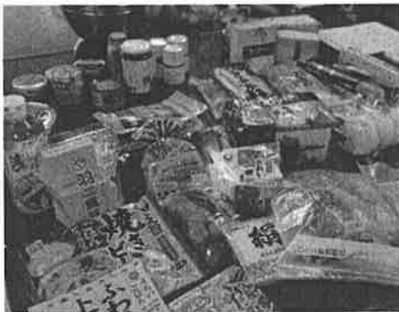
参加者が持ち寄った食材