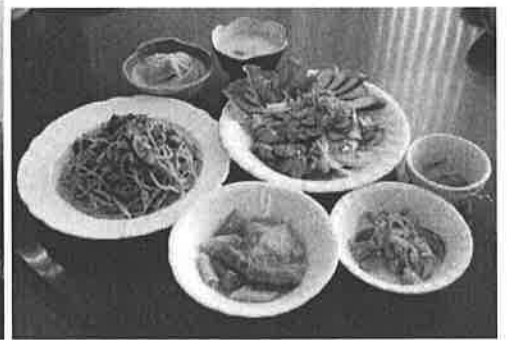
出来上がった料理