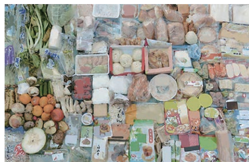
捨てられた手付かずの食品例

食べられるのに捨てられている食品ロスのこと。 日本では、年間600万トン以上の食品ロスが発生しています。 食品ロスの中には、手付かずの状態ですべて捨てられている食品もあり、この状況を多くの方に知っていただくことが大切です。