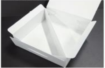
本体に仕切りを装着