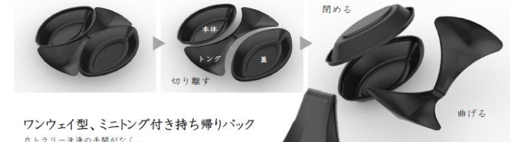
ワンウェイ型、ミニトング付き持ち帰りパック カトラリー洗浄の手間がなく、 未使用のトングで料理をつかむため衛生的