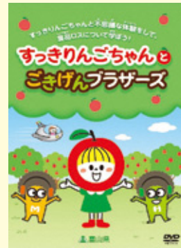
アニメ動画 「すっきりんごちゃんのごきげんブラザーズ」