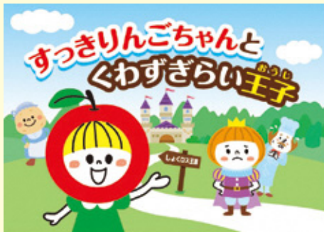
紙芝居 「すっきりんごちゃんとかわずぎらい王子」