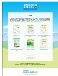
【オンライン展示の様子】