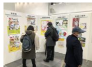
【パネル展示の様子】

参加者が先駆的な食品ロス削減の取組みの情報交換や交流ができる機会を創造するため、パネル・ブース展示を実施。