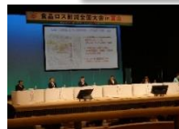
【トークセッションの様子】