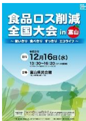
【大会パンフレット】