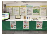
【ブース展示の様子】